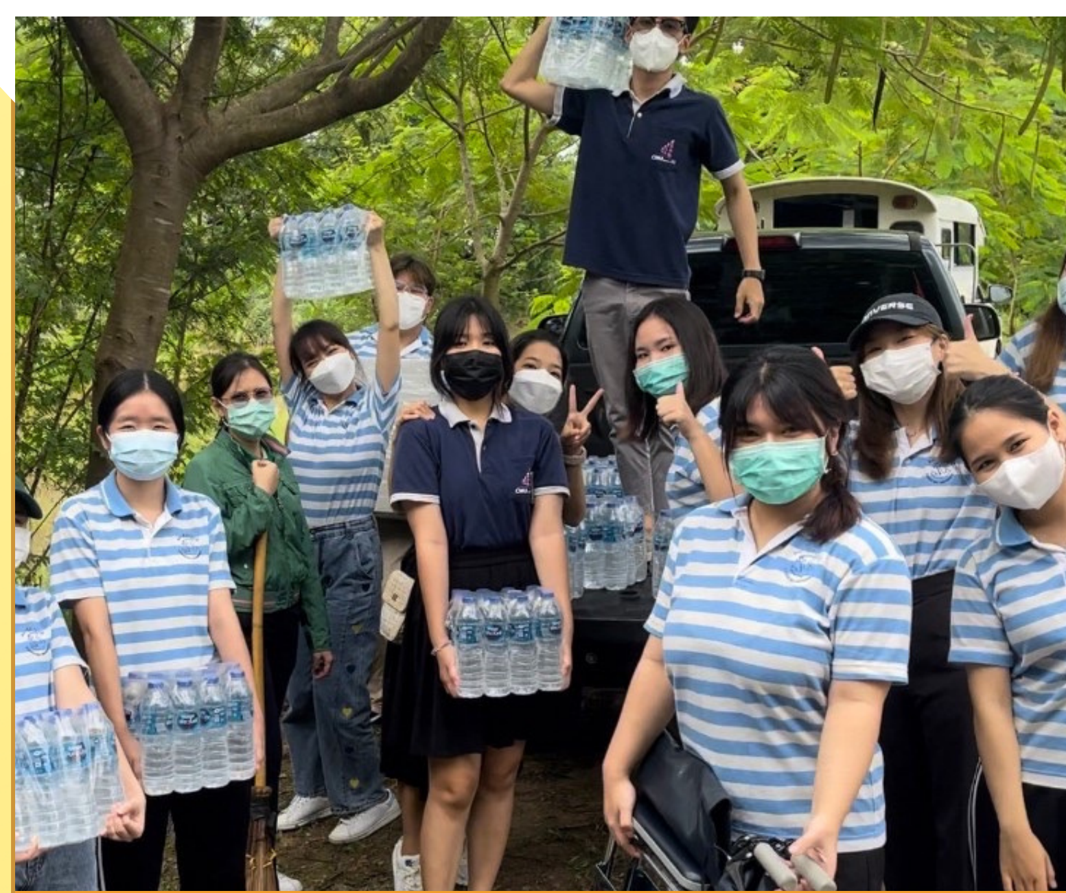
ส่งมอบอุปกรณ์เครื่องใช้ภายในบ้าน (น้ำดื่ม, แอมป์, ทีวี) ให้กับบ้านผู้สูงอายุ