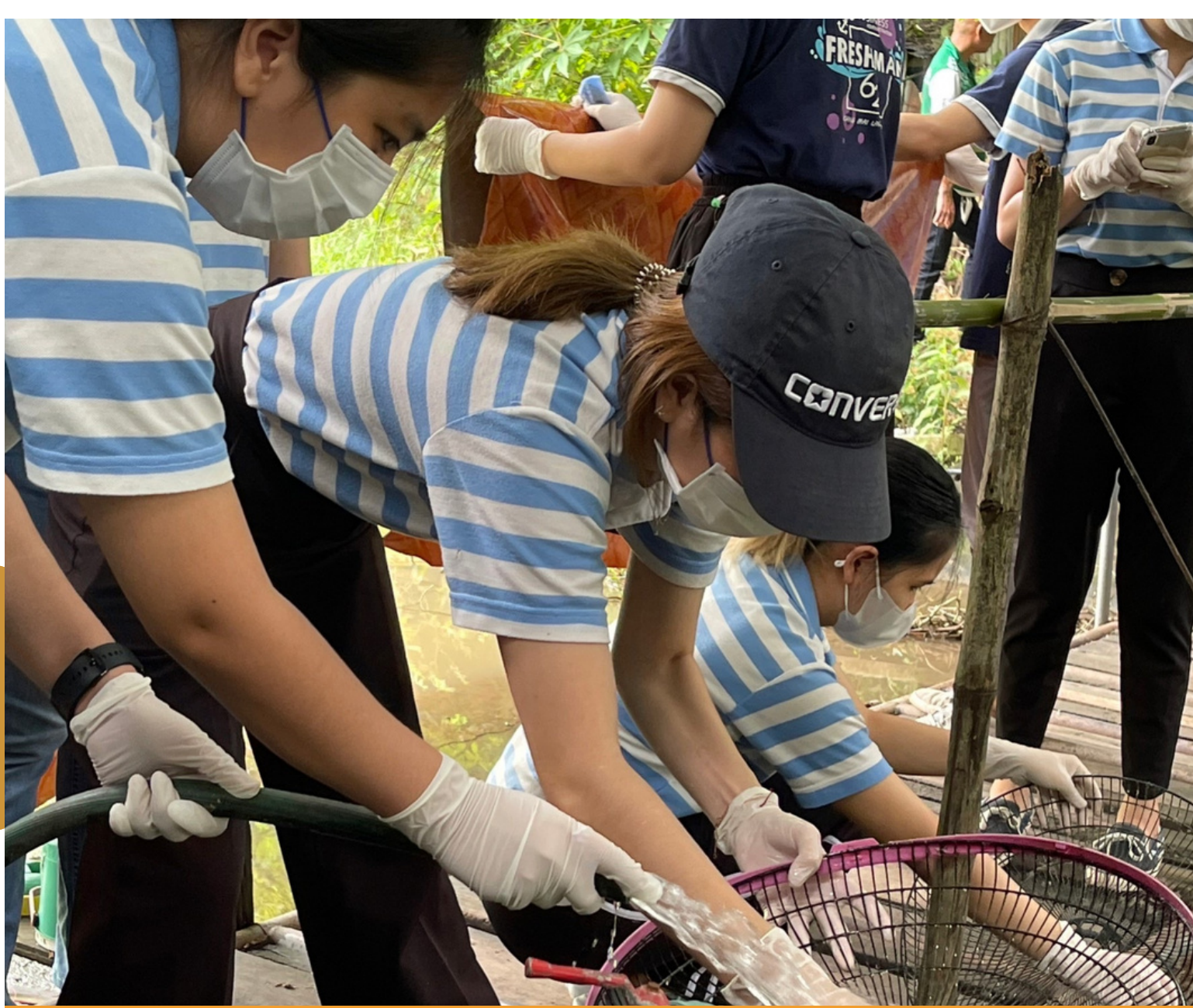
ทำความสะอาดบ้านของผู้สูงอายุ