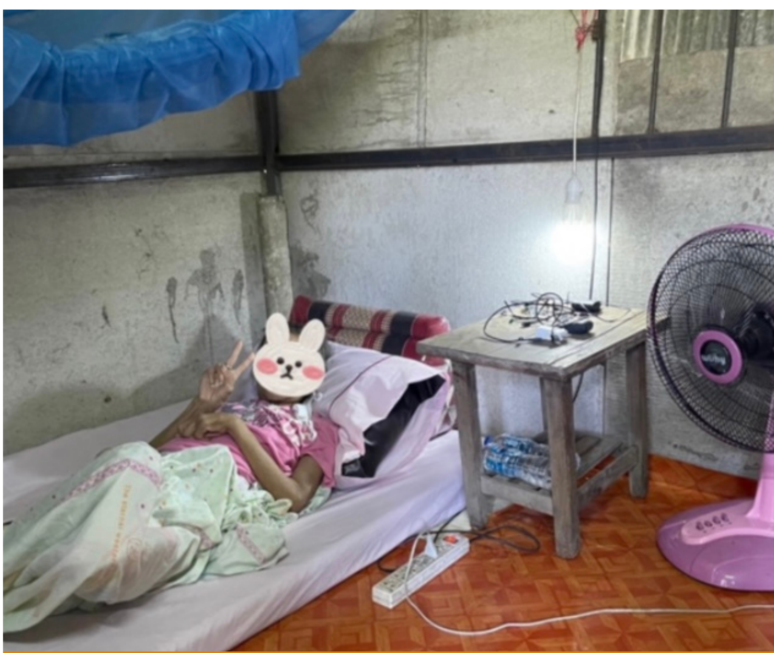
ภาพหลังการปรับภูมิทัศน์ภายในบ้าน