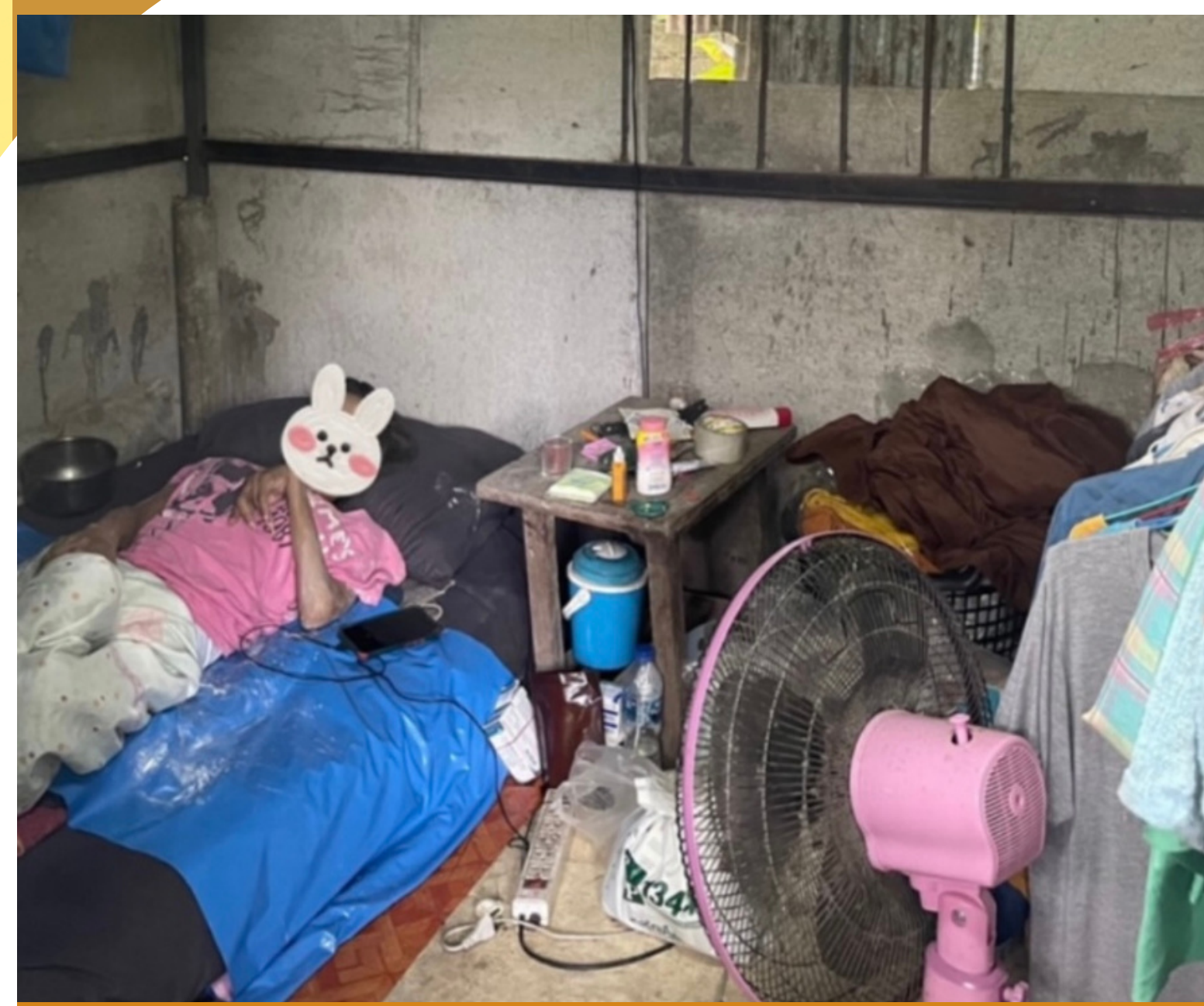
ภาพก่อนการปรับภูมิทัศน์ภายในบ้าน

การปรับภูมิทัศน์ให้กับผู้สูงอายุที่ป่วยเป็นโรคกล้ามเนื้ออ่อนแรง ผู้ดูแลศูนย์ผู้สูงอายุแม่เหิยะให้ความเห็นว่าจากทางที่คณะผู้จัดทำได้ลงพื้นที่ครั้งนี้สามารถทำให้นักศึกษาแพทย์เข้าไปทำกายภาพบำบัดได้สะดวกมากยิ่งขึ้นและสามารถดูแลผู้สูงอายุได้อย่างมีประสิทธิภาพมากขึ้น