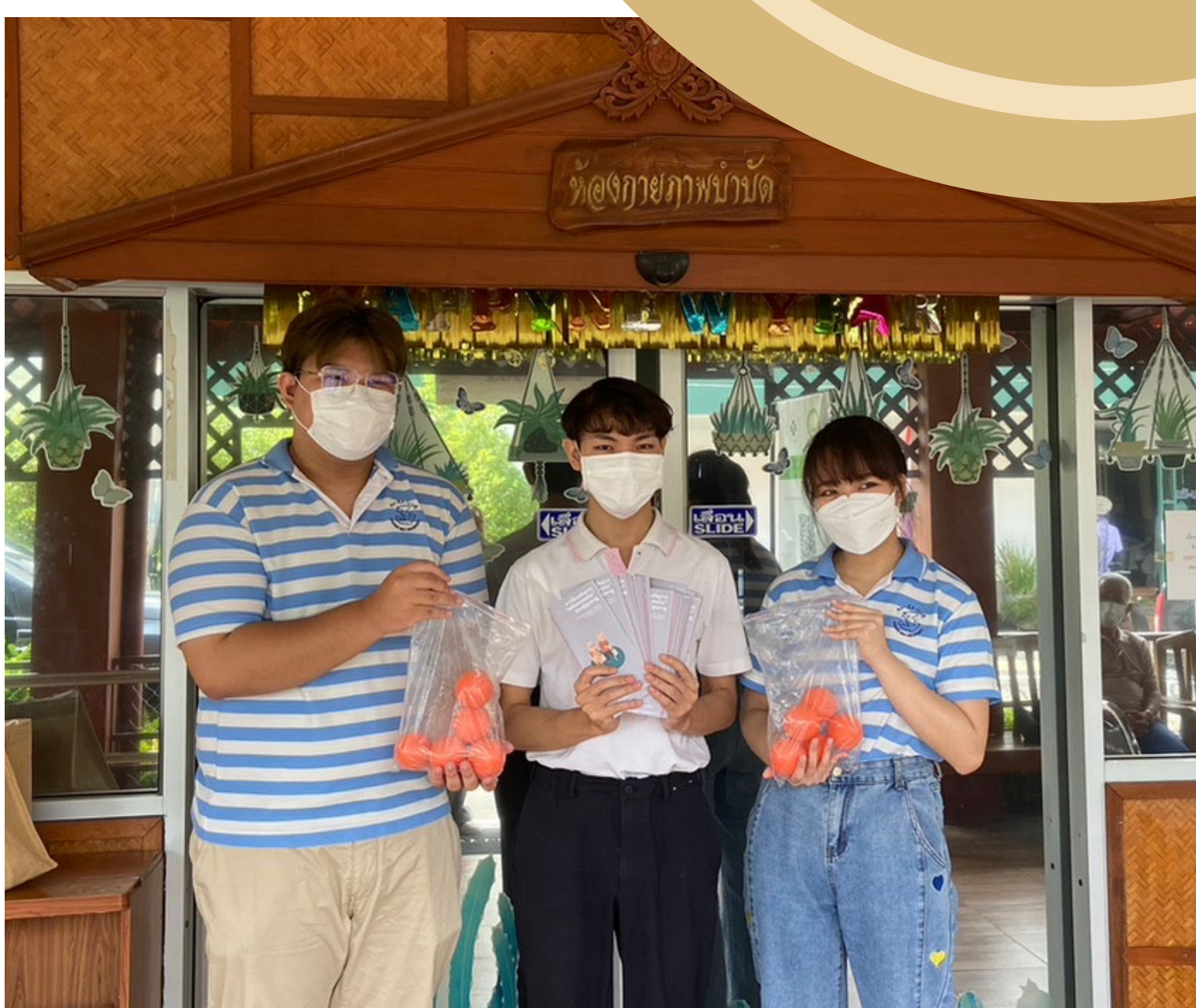
มอบอุปกรณ์กายภาพเบื้องต้น (บอลนวดคลายกล้ามเนื้อ) ให้ตัวแทนเจ้าหน้าที่