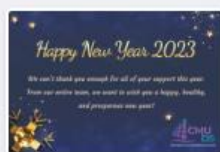
CMUBSecard-02.jpg December 22, 2022