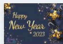
CMUBSecard-03.jpg December 22, 2022