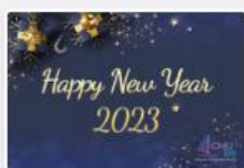
CMUBSecard-01.jpg December 22, 2022