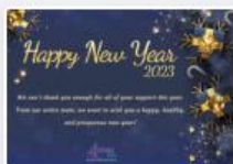
CMUBSecard-04.jpg December 22, 2022